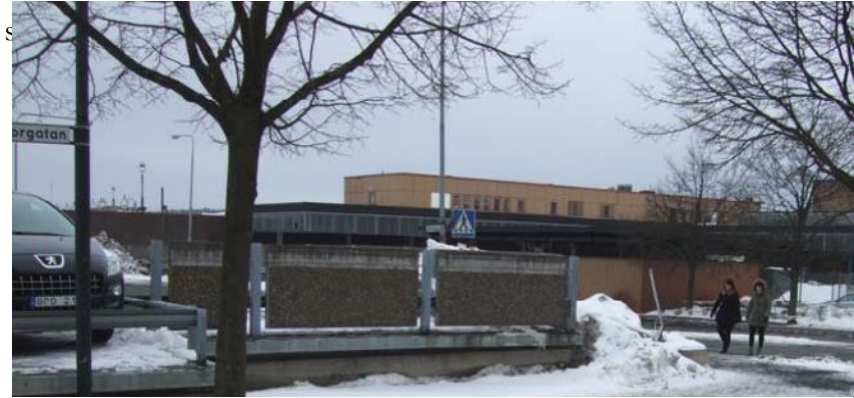
Tänkbar placering av en matvagn på kvarteret Oxen.

Kvarteret Oxen består främst av en stor parkeringsplats. I ena hörnet mot gågatan finns dock ett litet hack in i i parkeringsplatsen. Det skulle kunna vara en möjlig placering för en matvagn. Placeringen är bra i änden av gågatan med närhet till parkering och annonserar sig mot Bangårdsgatan. El kan möjligen dras från intilliggande Steakhouse i annat fall krävs att ny ledning dras en längre bit för anslutning till transformatorstation, vilket blir en dyr lösning.