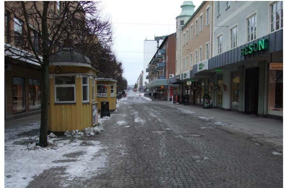
Tidigare stod det två gula kiosker på gågatan, men den ena stod tom och togs bort.

På gågatan finns i dagsläget en gul kiosk från vilken bland annat korv säljs. Ska ytterligare försäljning ske på gågatan bör det ske från en kiosk som liknar befintlig kiosk. Mobila försäljningsvagnar skulle i de flesta fall skymma bakomvarande affärslokaler och passar dessutom inte tillsammans med befintlig gul kiosk. Mobila försäljningsvagnar tillåts därför inte på gågatan.