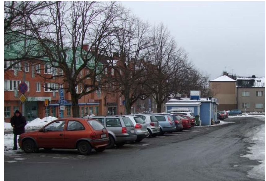
På Södra torget står en blå kiosk som säljer mat.

På Stora torget står i dagsläget en kiosk. Här skulle vara möjligt att komplettera med en försäljningsvagn med en annan inriktning så att utbudet breddas. Här finns god tillgång till parkering. El kan dras från exempelvis den transformatorstation som finns vid befintlig kiosk.