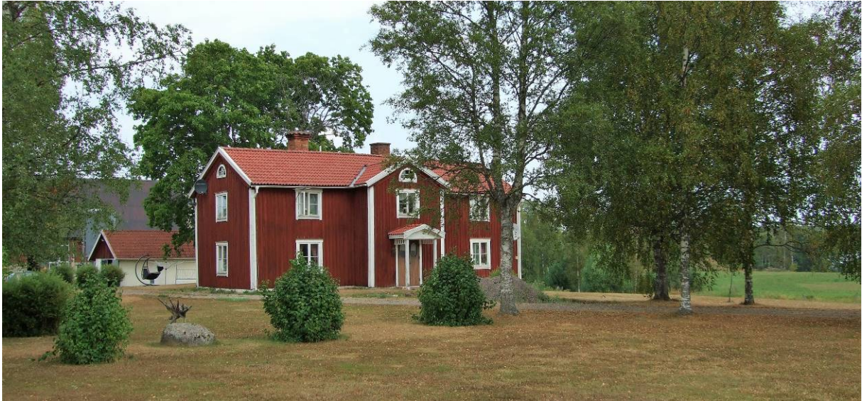
Bostadshus på 1:3.