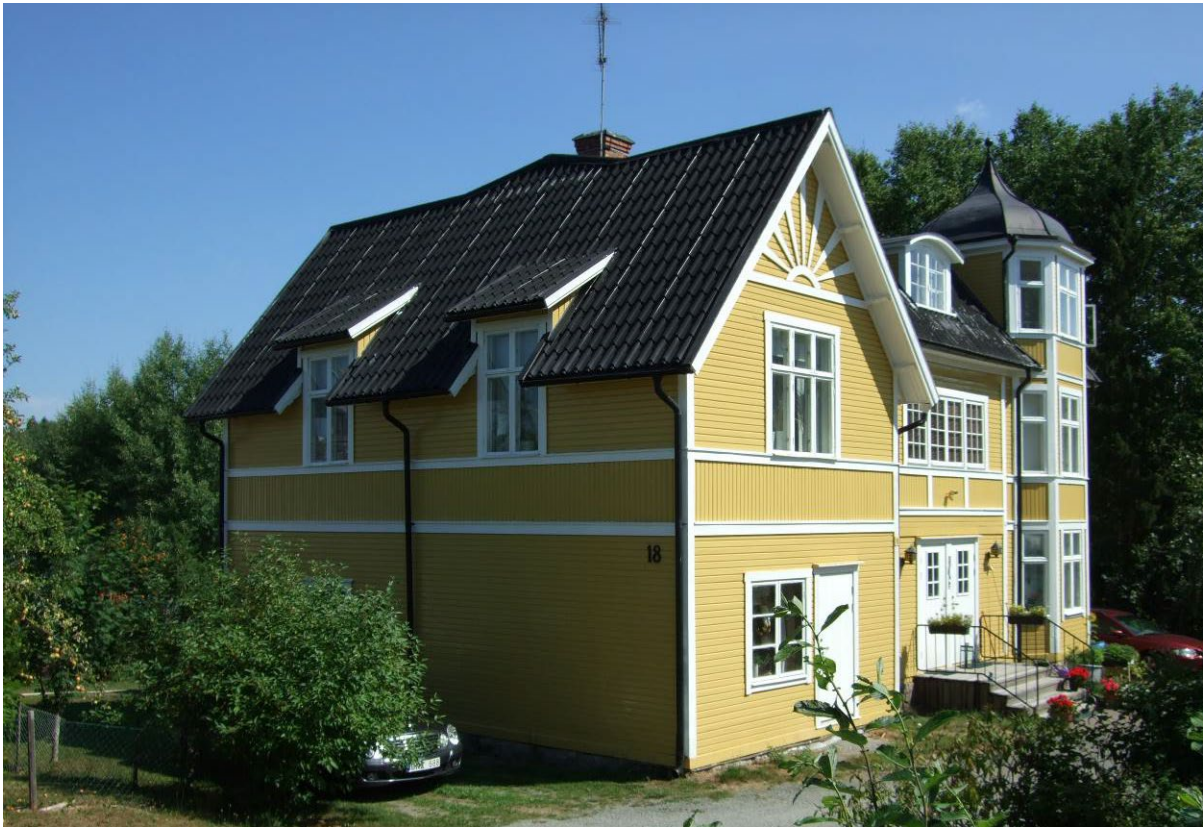
Bostadshus på Pilabo 1:29.

Området visar en variation av byggnader i det äldre centrum i Anneberg som uppstod under decennierna kring sekelskiftet 1900.