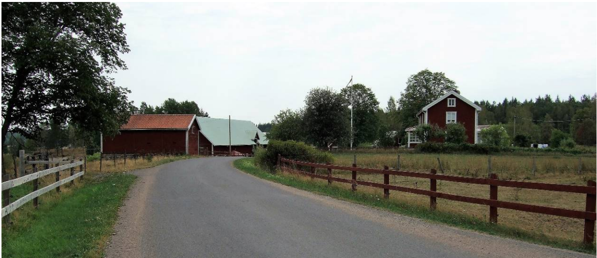
Vy mot 2:2.