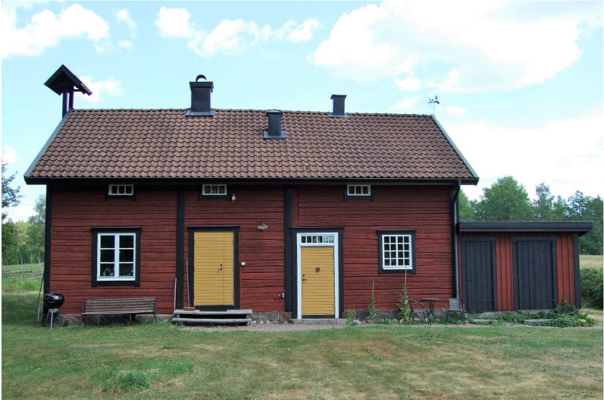
Avträdet och drängstugan.