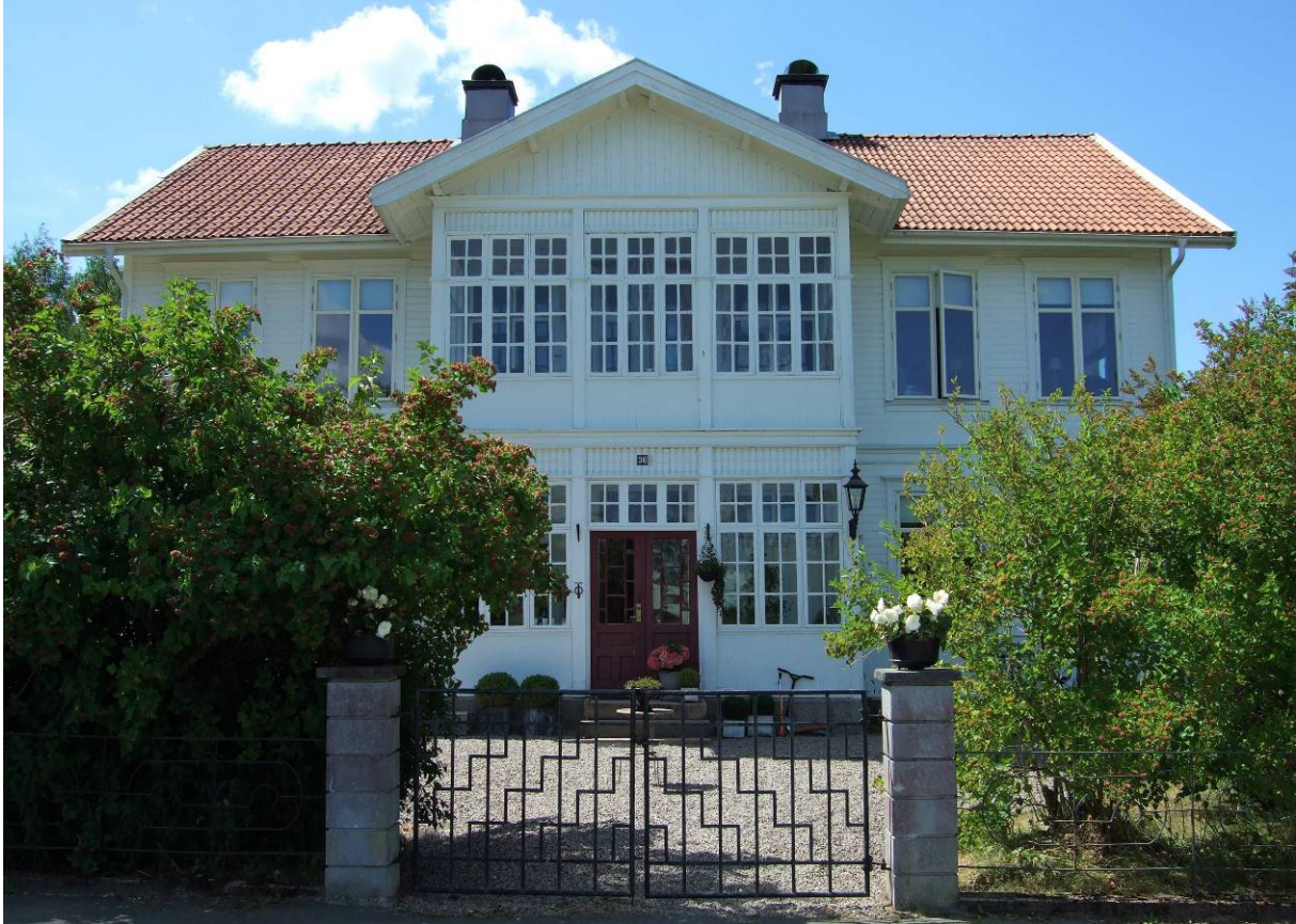
Bostadshus på 1:23.