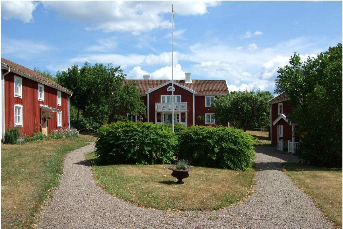
Huvudbyggnaden med flyglarna på vardera sidan.

Klass: 3 - Särskilt allmänt bebyggelsevärde (PBL 8 kap §17)