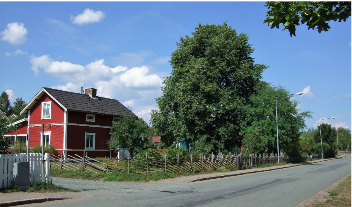
Vy längs Ormarydsvägen i nordlig riktning.