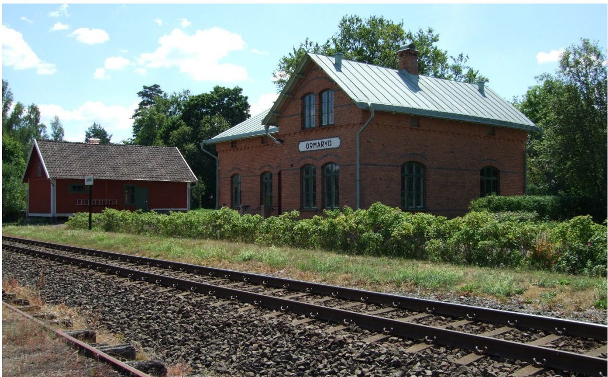
Stationshuset och godsmagasinet intill.

Klass: 2 - Särskilt värdefull bebyggelse (PBL 8 kap §13)