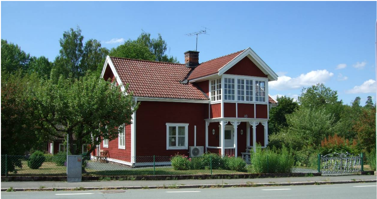
Bostadshus på 1:3.

Solavägen 40, 38, fastighet Solberga-Näs 1:3, 1:23 Klass: 4 – Allmänt bebyggelsevärde (PBL 8 kap §17)