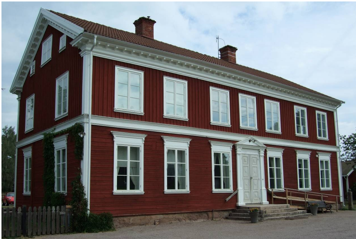
Före detta kyrkskolan.