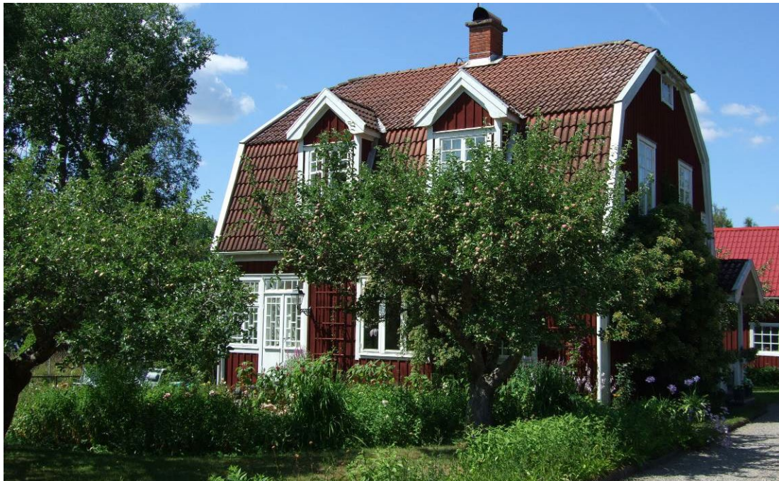
Bostadshus på 1:59.