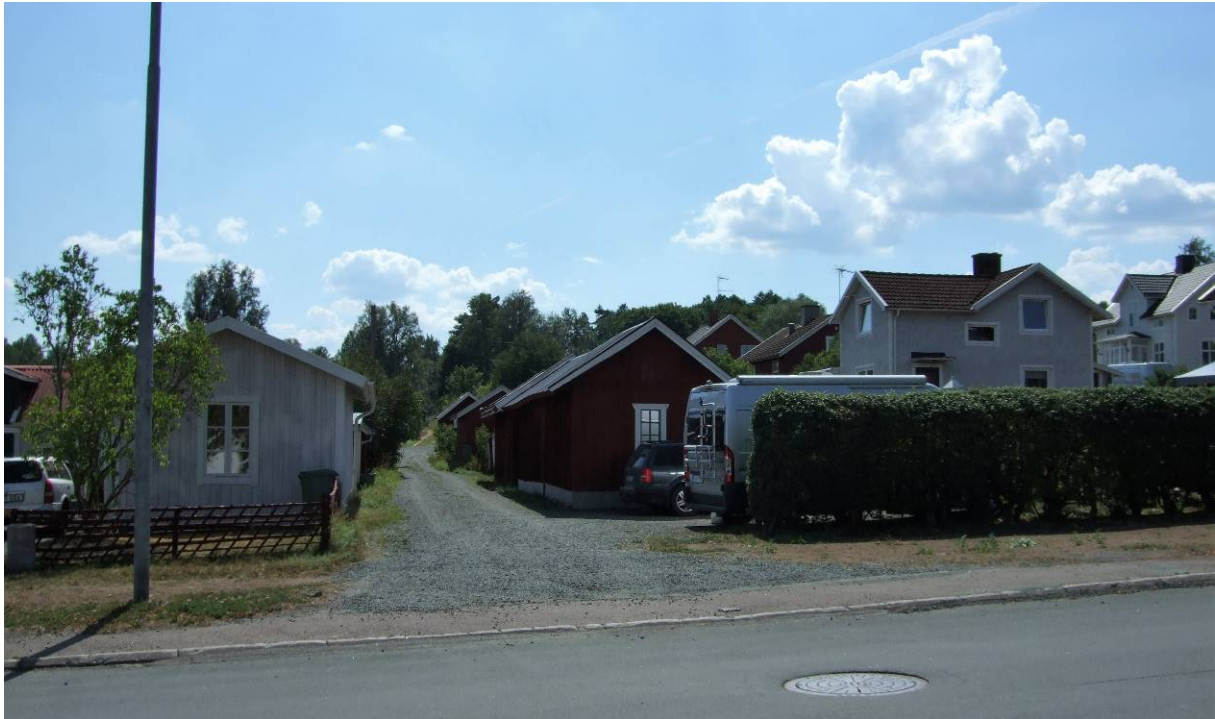
Vy från Allén i sydlig riktning.

Klass: 4 - Allmänt bebyggelsevärde (PBL 8 kap §17)