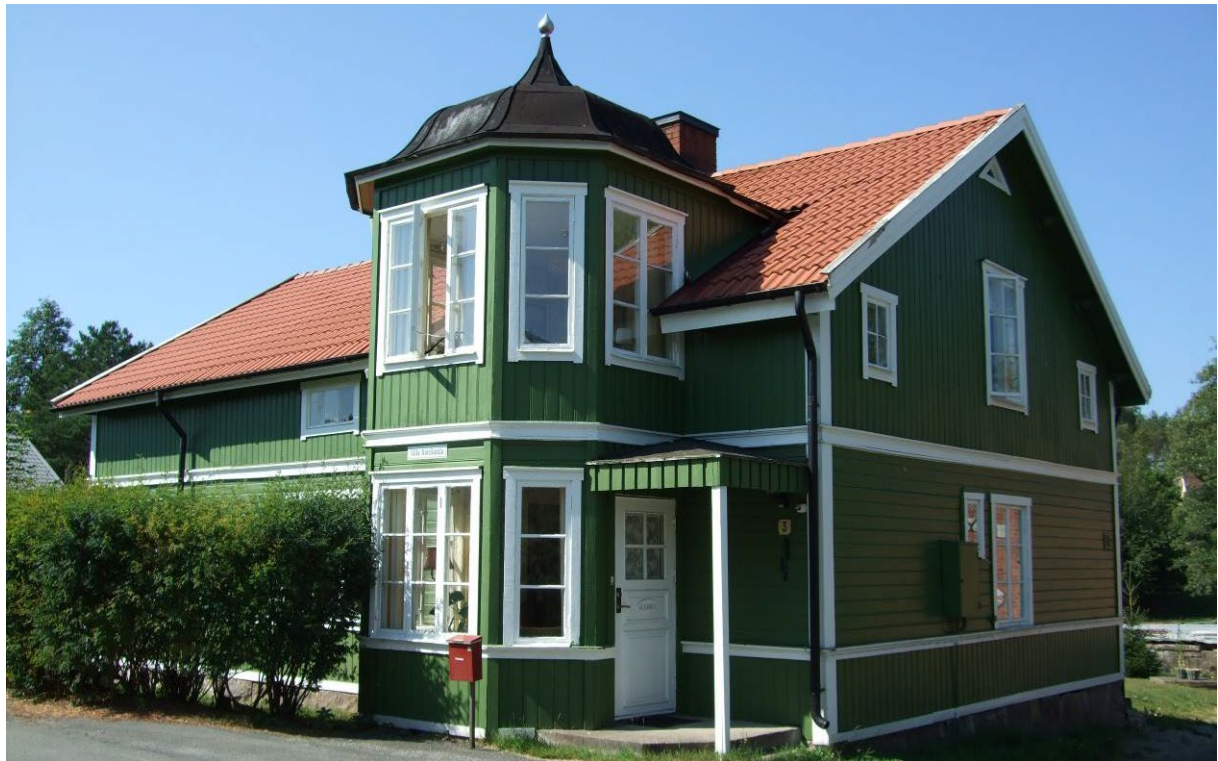
Bostadshus tillhörande Heines bryggeri.