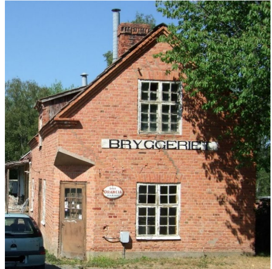
Bostadshus på Sälgen 6 t v och Heines bryggeri t h.