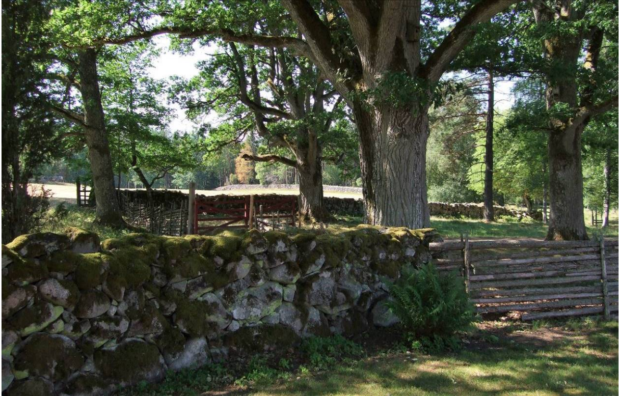
Delar av stenmurarna som sträcker sig över gårdens marker.