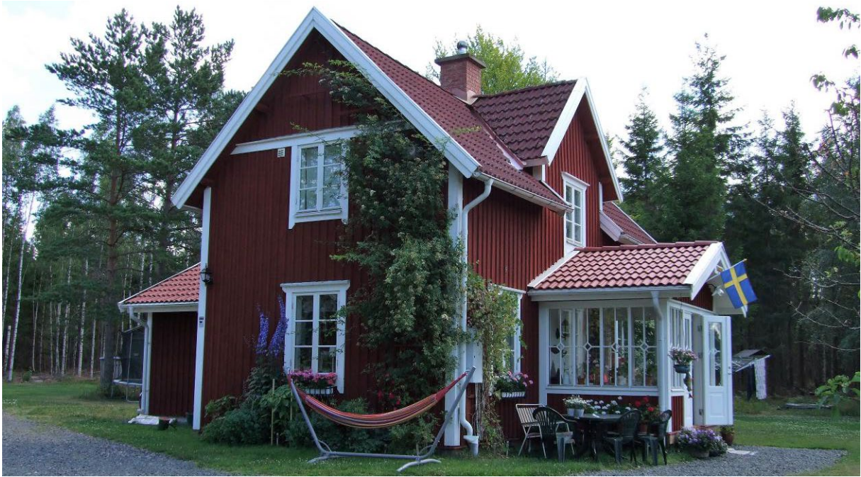
Hus på 1:92.

Området ger en förståelse för den bebyggelse som fanns i området innan järnvägssamhället tagit form.