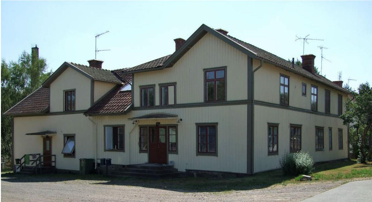
Före detta fabrikskontoret.