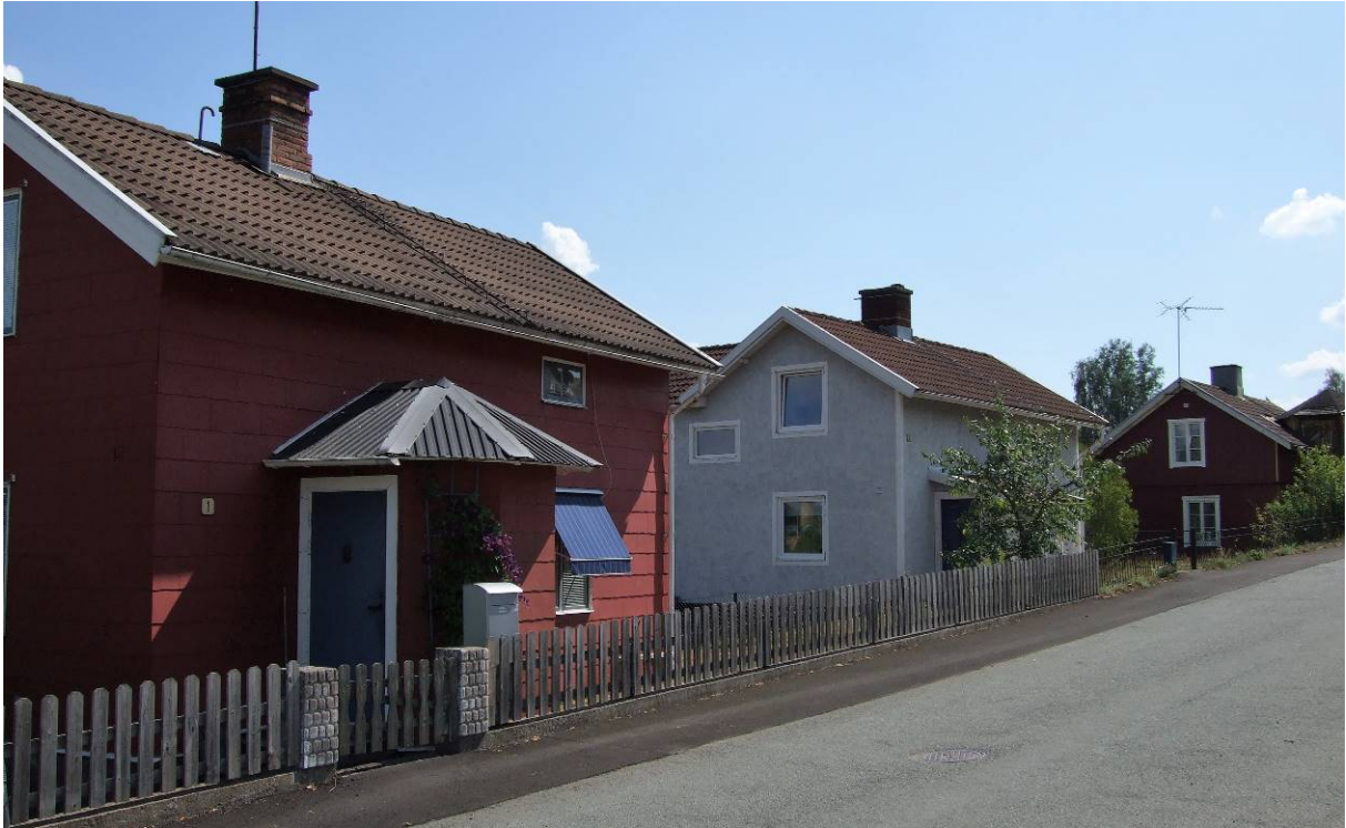
Fastigheter längs Pilabovägen.