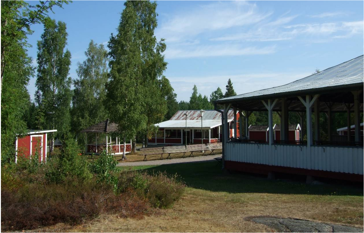
Vy över parken, dansbanan närmast till höger, musikpaviljongen och kaffestugan.