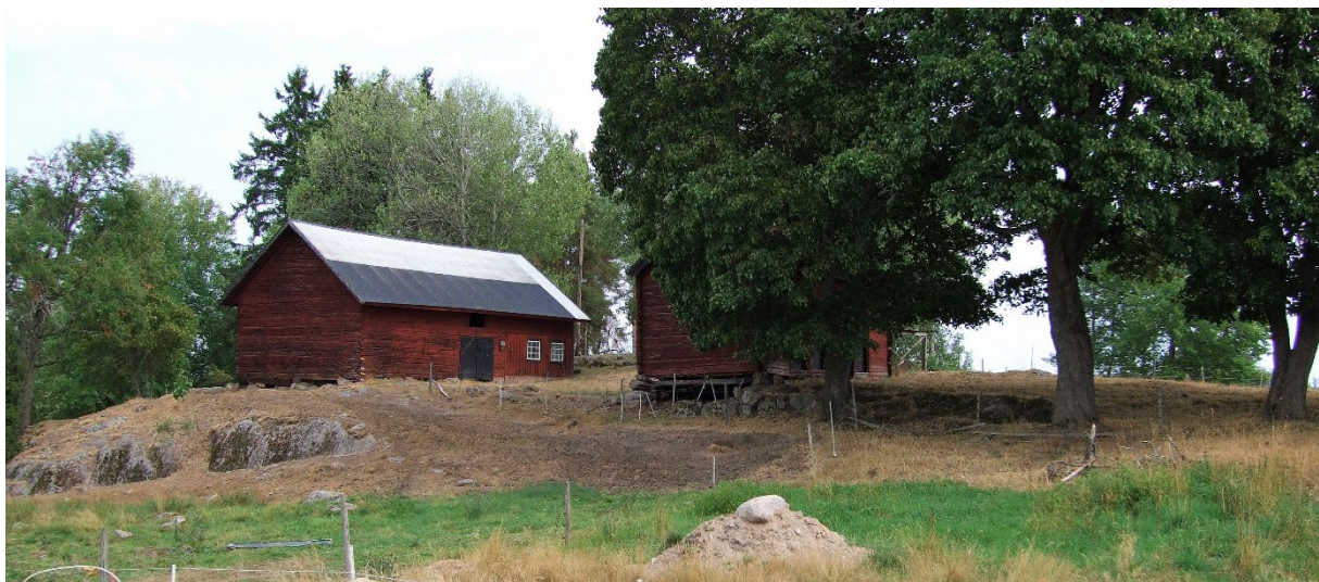
Ladugårdar på 1:2.