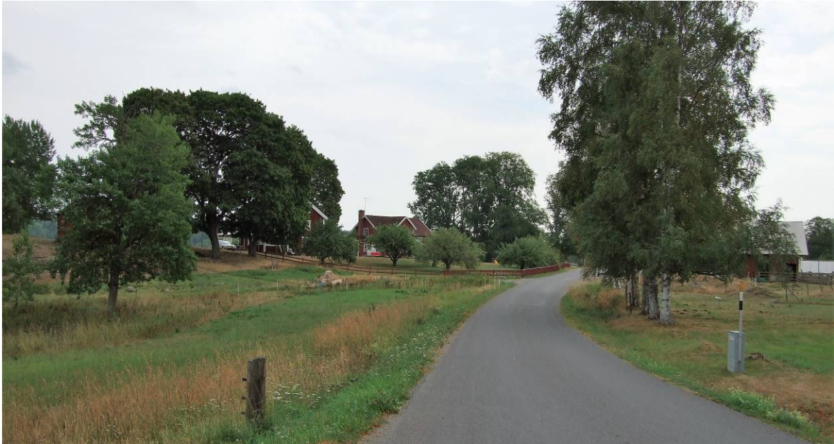
Vy mot 1:2.

Klass: 4 - Allmänt bebyggelsevärde (PBL 8 kap §17)