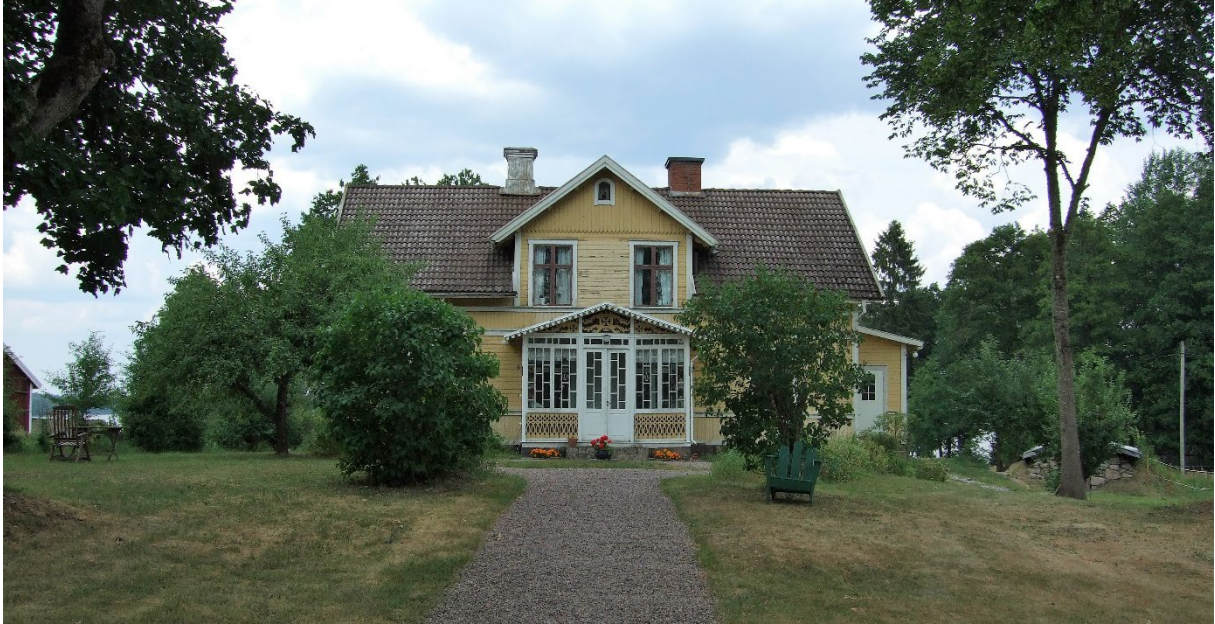
Bostadshus på 1:39.

Området uppvisar en by med ett flertal byggnader som tillkommit vid olika tider och behållit mycket av dess ålderdomliga utseende.