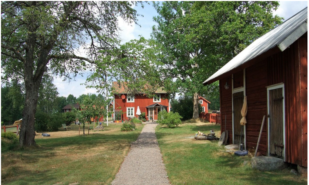
Bostadshus på 1:31.