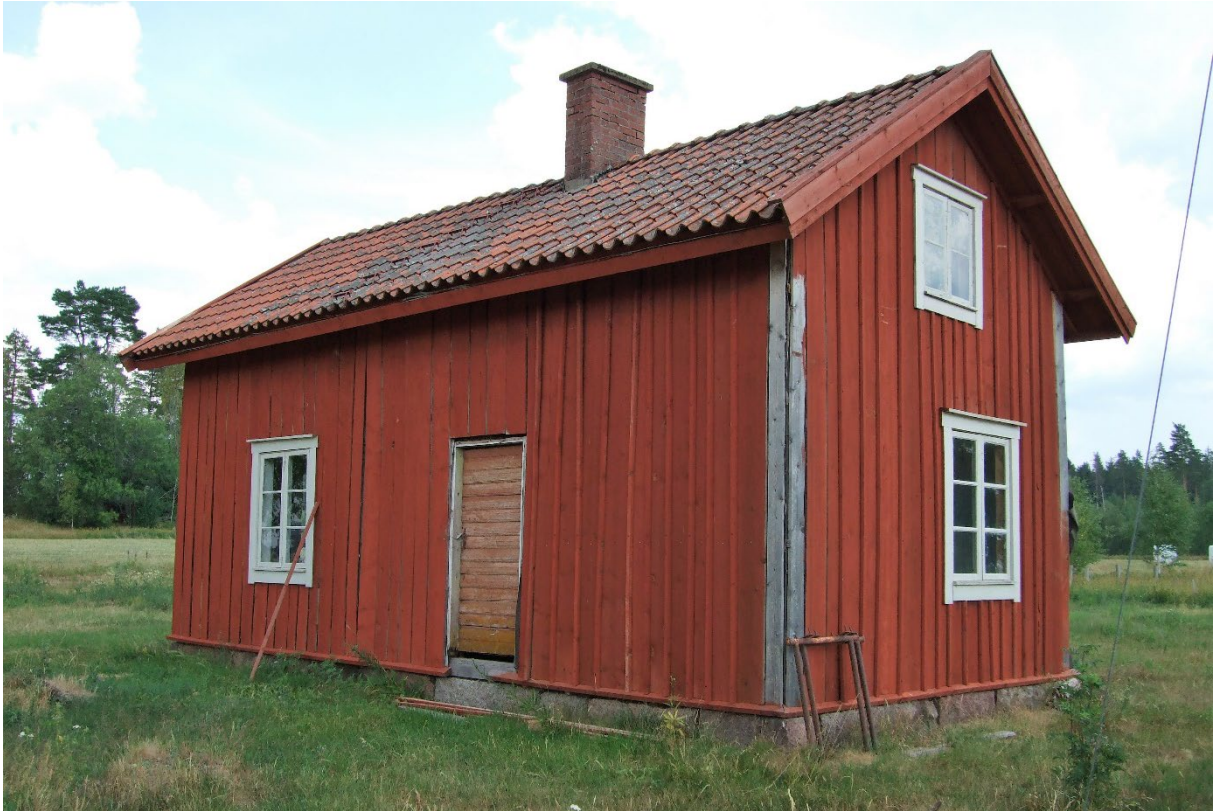
Enkelstuga på 1:32.