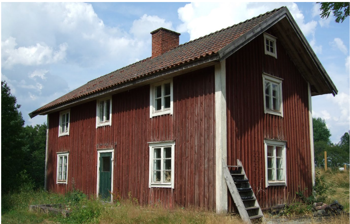
Hus på 1:37.