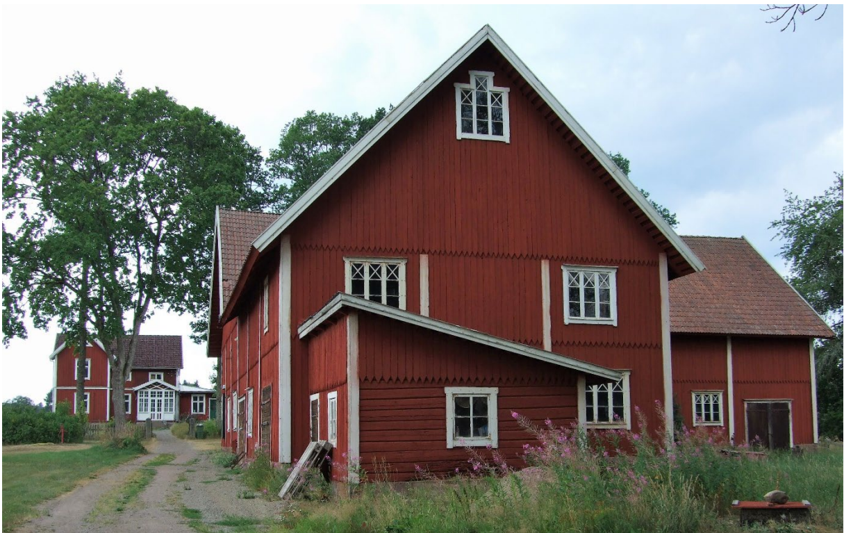
Ladugården på 1:6 i förgrunden och bostadshuset 1:36 i bakgrunden.