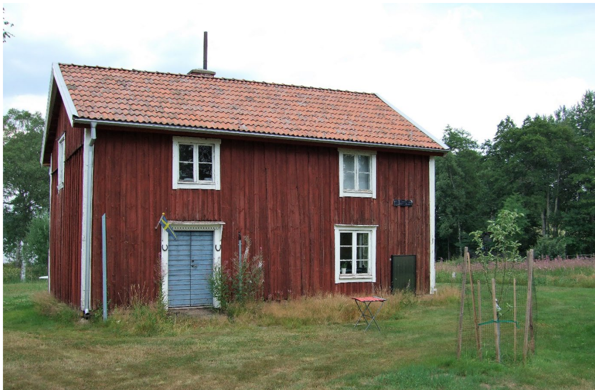
Enkelstugan på 1:6.

Hästerum gamla stugan 1, Hästerums gård 1, Hästerum Oskarsgården 1, Hästerum 26, 10, 28, 27, 35, 36, Hästerum Lidbäck 1, fastighet Hästerum 1:6, 1:14, 1:31-1:34, 1:36-1:39 Klass: 3 - Särskilt allmänt bebyggelsevärde (PBL 8 kap §17)